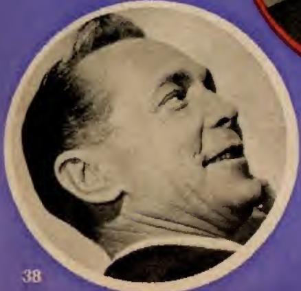
Douglas Fairbanks jun., Mann und Schauspieler von Format.